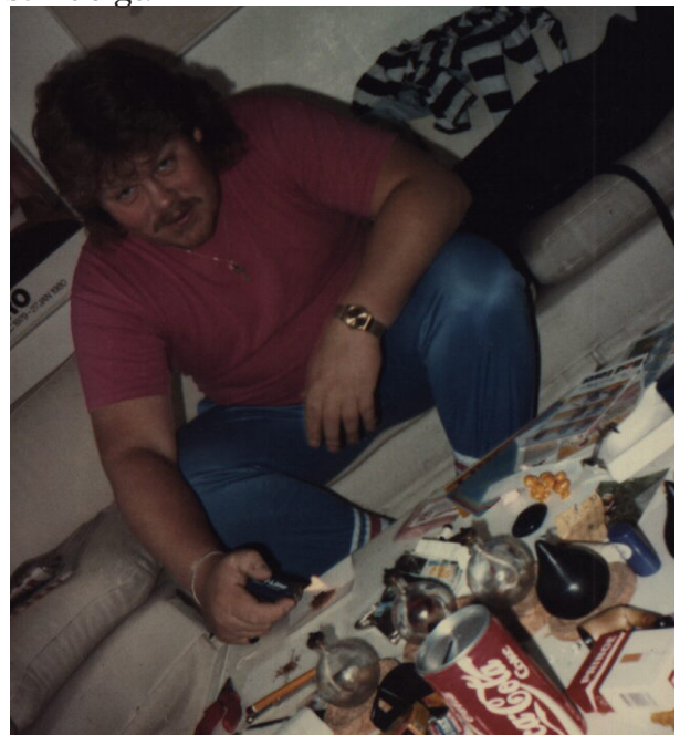
<-- GanjaFarmer Light?