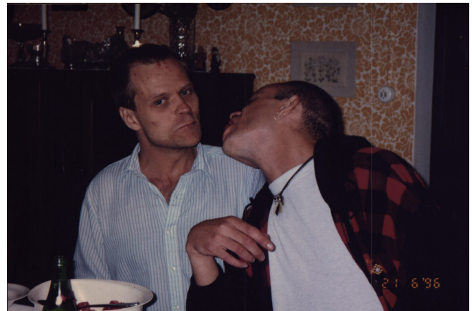
Har Kristian Luuk en tvillingbror? Och vad gör han i så fall i homosexuella sammanhang?