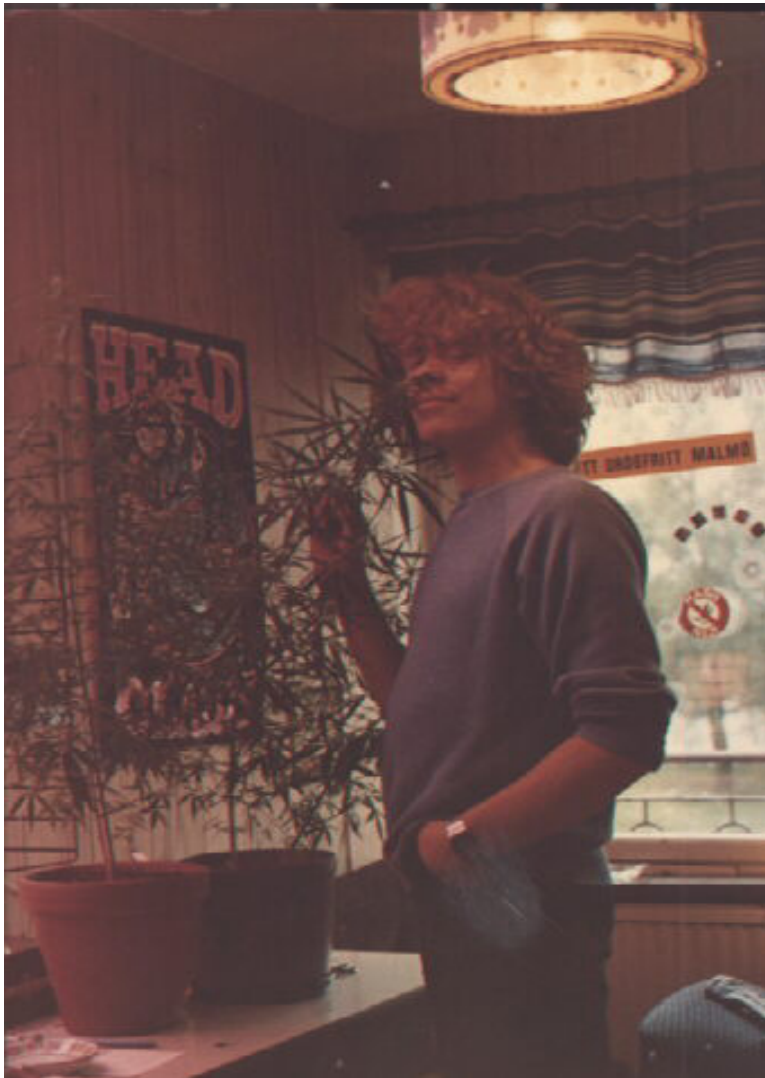
Observera ovan skylten "FÖR ETT DROGFRITT MALMÖ". Till höger ser vi en tysk lastbilschaffis som meckar hasch.