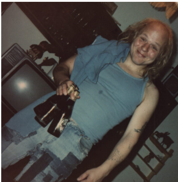
Här är beviset: Vi behöver verkligen lagar som begränsar hur man ser ut.